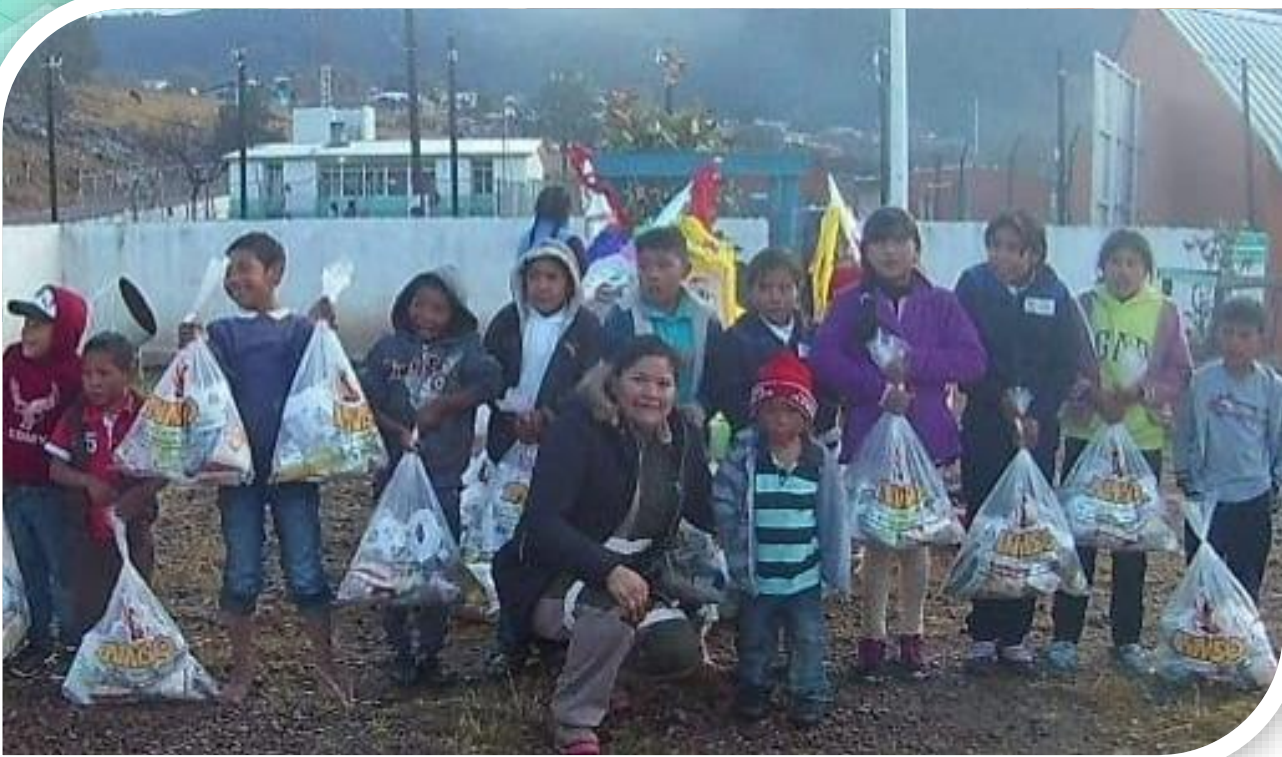
Comunidad "Turuachi" Guadalupe y Calvo Chihuahua