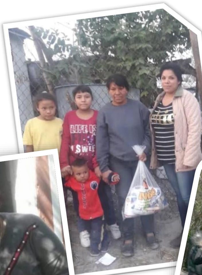
Municipios - Escobedo - Garcia - Anáhuac - Villaldama - Linares Nuevo León