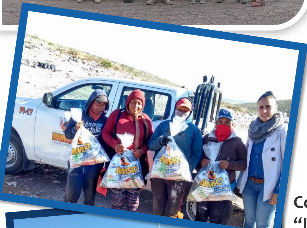
Colonia "La Fe" Fresnillo Zacatecas