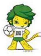
ZAKUMI SUDAFRICA 2010