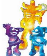
Spheriks Japon y Corea 2002