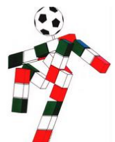
Ciao Italia 90