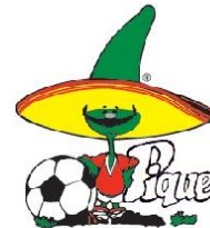
Pique Mexico 86