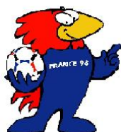
Footix Francia 98