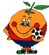
Naranjito España 82