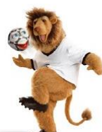
Goleo Alemania 2006