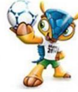
FULECO BRASIL 2014