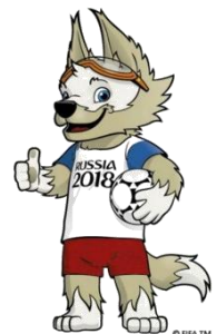
Zabivaka Rusia 2018