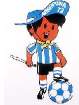
Gauchito Argentina 78