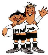
Tip y Tap RFA 74